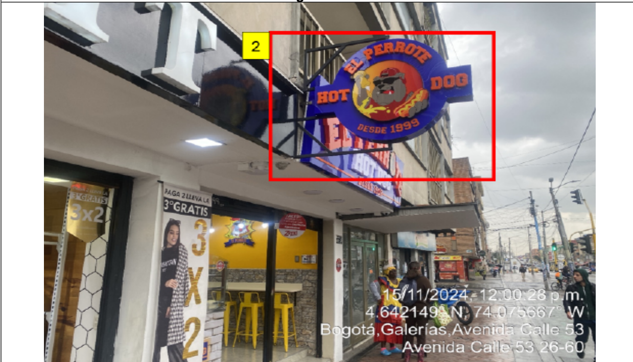
En la cual se evidencia un (1) elemento PEV volado de la fachada, identificado con el número 2.