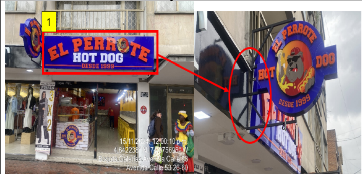
En la cual se evidencia un (1) elemento PEV volado de la fachada, identificado con el número 1.